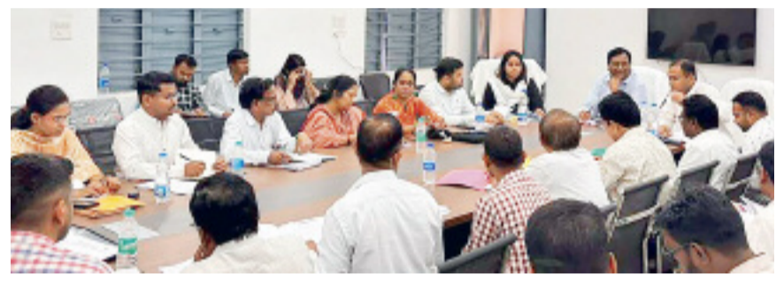
हरिभूमि न्यूज ▶▶ कोण्डागांव

बस्तर संभागायुक्त डोमन सिंह ने मंगलवार को केशकाल जनपद पंचायत सभाकक्ष में बैठक लेकर विभिन्न शासकीय योजनाओं के क्रियान्वयन की विस्तृत समीक्षा की। बैठक के दौरान संभागायुक्त ने राजस्व प्रकरणों का निर्धारित समय-सीमा में निराकरण सुनिश्चित करने पर विशेष जोर दिया। उन्होंने कहा कि आम नागरिकों से जुड़े मामलों में किसी भी प्रकार की देरी स्वीकार्य नहीं होगी। उन्होंने वन अधिकार पत्र के वारिसों के नामांतरण से संबंधित